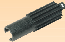
CK11 Chiave avvita connettori per avvitarlo o svitarlo i connettori F alla presa di accoppiamento (LNB, multiswitch, ecc.)