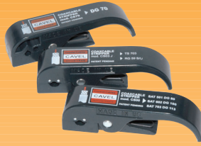
CS00 Spelacavo multiuso adatto ai cavi con Ø 5,0 - 7,0 mm