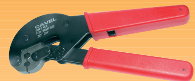
CRT03 (sezione .262" e .324") CRT04 (sezione .324" e .360") CRT05 (sezione .324" e .475") Pinze per crimpare per fissare i connettore F a crimpare al cavo coassiale