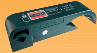
CS17 - CS22 - CS27 - CS34 Spelacavi per cavi da distribuzione Ciascun modello è dedicato ad uno dei cavi coassiali da distribuzione per posa interrata (serie FC)