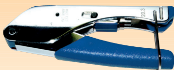
COT04 Pinza a compressione per i connettori BNCC501SL-703SL

N.B. La sezione .324" (comune alle tre pinze) è adatta per i cavi di dia. esterno 4,3 ÷ 6,8 mm