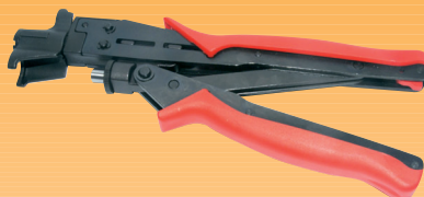
COT02 Pinza a compressione per i connettori FC703SL, FC501SL e FC11 (adatta anche per connettori a compressione F e IEC per i cavi RG59 e RG6)