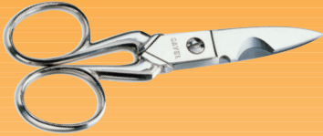
FC02 Forbici per la preparazione di tutti i cavi coassiali all'inserimento del connettore