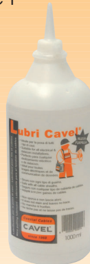
LUB01 Lubri Cavel (1 litro) Lubrificante per fili e cavi riduce l'attrito facilitando il passaggio dei cavi nei condotti. È a base di acqua e non è pericoloso per l'utilizzatore. E' stabile fino a +82°C e congela a -5°C