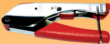
COT05 Pinza a compressione universale per i connettori F, IEC e BNC